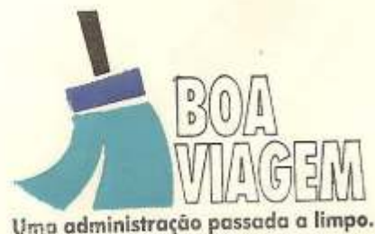
ANTONIO ARGET NUNES VIEIRA PREFEITO MUNICIPAL

PAÇO DA PREFEITURA MUNICIPAL DE BOA VIAGEM-CE, aos 26 de maio de 1995.